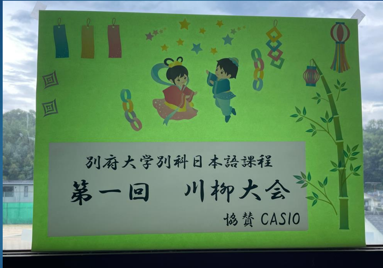
別府大学別科日本語教育課程において、川柳大会が開催されました（2024年6月）